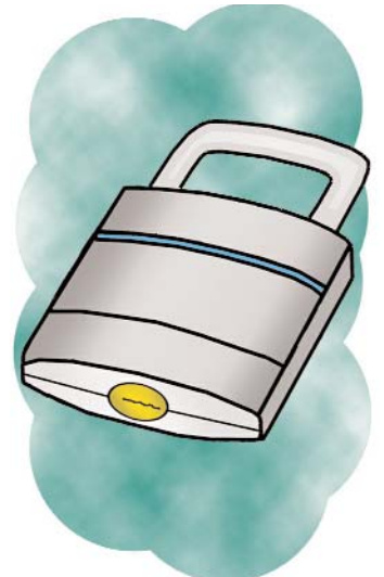
el candado/padlock /k/ inicial