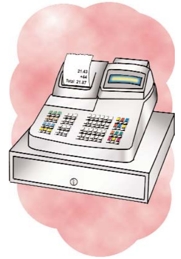
la caja/cash register /k/ inicial