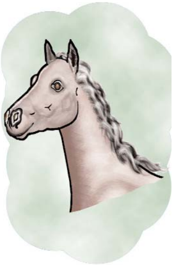
el caballo/horse /k/ inicial