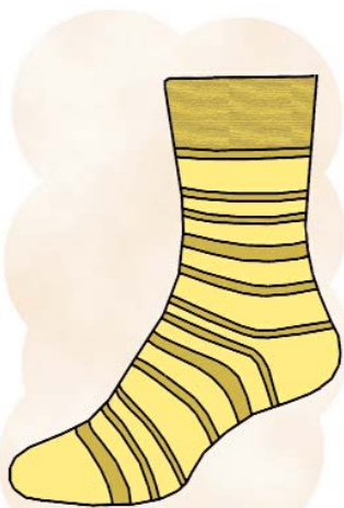
el calcetín/sock /k/ inicial