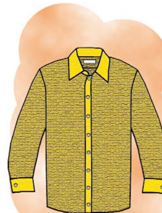
la camisa/shirt /k/ inicial