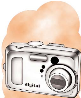
la cámara/camera /k/ inicial