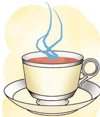
el café/coffee /k/ inicial